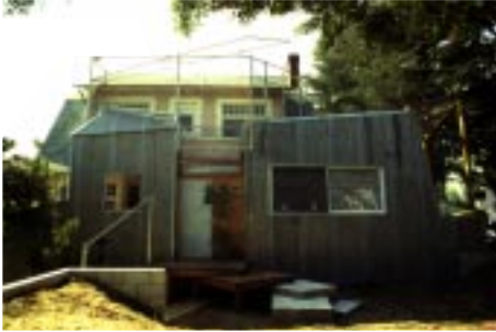
Frank Gehry, 'Gehry House', Santa Monica, 1978-79

"Tingens kant kan være dens alleryderste, dens kontur og omrids; men kanten kan også være dens yderste stykke, de yderste, relativt selvstændige dele af den, dens udkanter." 17