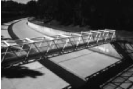
Los Angeles River Studio City, 1997

tale kort' en grænse, man kun overskrider med livet som indsats. Et andet eksempel på et 'udkantsrum' er de næsten allestedsnærværende stormflodskanaler, der som 20 meter brede betonrande skærer sig gennem Los Angeles' grønne beboelsesområder. Stormflodskanalerne er normalt utilgængelige og umulige at krydse, hvorfor de fungerer som effektive grænser mellem neighborhoods f.eks. mellem det rige og næsten