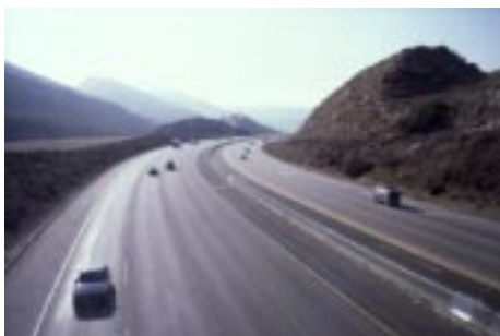
Ronald Reagan Freeway Simi Valley, 1997

Forstæderne i det sydlige Californien, specielt omkring Los Angeles, udviklede sig meget hurtigt efter at idéen først havde slået an. Fra at have en befolkning på 3.530 ved grundlæggelsen som amerikansk by i 1850 voksede Los Angeles området 30 til i 1900 at have en befolkning på 170.298, 2.208.492 i 1930 og 4.151.687 i 1950. 31