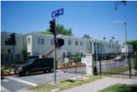
Gated Community, 'Park La Brea', Los Angeles, 1997

cirka 500 indbyggere. Det anslås at 500.000 personer i Californien bor i 'gated communities' hvoraf fire i Los Angeles-området – Hidden Hills, Rolling Hills, Canyon Lake og Leisure World Laguna Woods – har status som by, og dermed har ret til eget politi, skatteinddrivning og brandvæsen.