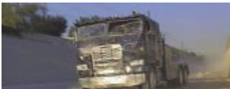
James Cameron 'Terminator 2', 1991

Grænsens karakter som kant, mærke og rum er ikke en stabil størrelse, men en der ændrer sig i takt med at samfundet, holdningen til det at bosætte sig og individets position i forhold til grænsen ændres op gennem forstadens udvikling. For den, som aktivt udtrykker eller møder grænsen, er karakteren af den position, hvorfra grænsen udtrykkes væsentlig. Grænsen kan udtrykkes med udgangspunkt i en bevægelig og ubegrænset position, eller den kan udtrykkes med udgangspunkt i en stationær og allerede afgrænset position og få