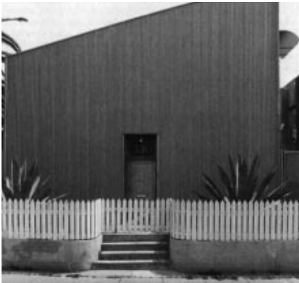
BAM Construction/ Design Inc.'s, 'Venice Studios' ( 'Hopper House' ), Venice 1990.

Man vil markere denne position med et mærke, der som en blid grænse signalerer, at man er en del af en homogen mængde, men alligevel ønsker at markere et individuelt ejerforhold. Det samme slogans ønske om at være væk fra det hele, er faktisk et ønske om, at danne et fysisk værn eller en kant mod det ukendte andet, hvilket i flere grader spænder fra neighborhooden ved siden af med en anden holdning, over ønsket om at slippe fri fra forurening og bilkøer, til et ønske om at værne mod trusler fra, hvad der måtte være af bandekriminalitet, 'mudslides' og 'mountain lions' 14 . Kort sagt desto mere homogent et neighborhood er indadtil, jo flere grænser bliver mar-