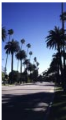
Beverly Drive, Beverly Hills, 1997

"... with a few additions to its acreage, it was incorporated as a single city, capable of being armed with the necessary ordinances to defend its social make-up and rather arty standards of design." 38