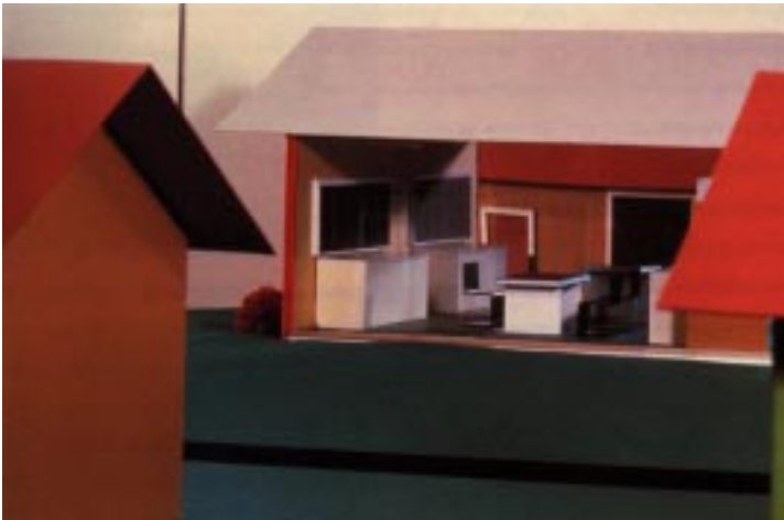
Dan Graham, 'Alterations of a Suburban House' , 1978

I 1978 foretog den amerikanske installationskunstner Dan Graham et indgreb i en tænkt – men dog meget sandsynlig forstadsbolig, i værket 'Alterations of a Suburban House' . Han erstattede hele den ene side af boligen med én stor glasfacade, men lod ellers alle møblerne i opholdsrummet stå, så de forbipasserende kunne se, hvad