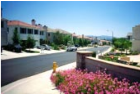
Typisk beboelsesområde i de yderste forstæder, West Hills, Los Angeles, 1997

For at uddybe denne 'grænsens mekanik' kan grænsedragningens produkt deles op i to grupper: kanter og mærker. Kanter – og herunder rande, er faktiske grænser mod et ubestemt andet som den alleryderste udkant, mens mærker – og herunder skel, er legitime grænser mellem noget bestemt andet af samme slags (mellem marker, parceller, rettigheder etc.). Kanter udtrykkes gennem 'væren, kunnen og turden' mens mærker udtrykkes gennem 'burden'.