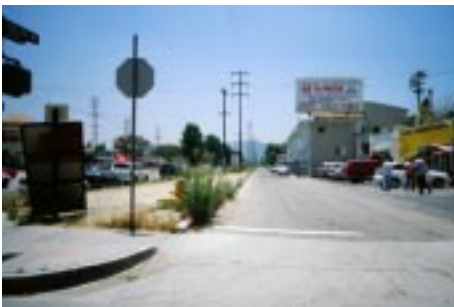
Vineland Avenue, North Hollywood, 1997

er Vineland Avenue i North Hollywood, et af de gamle neighborhoods i San Fernando Valley i den nordlige del af Los Angeles, der blev udstykket som forstad først i 1888 og siden i 1911. Som 'Gateway to the San Fernando Valley' var North Hollywood et gennemfartssted for Pacific Electric's sporvogne, der kørte i midten af Vineland Avenue flankeret af firesporede veje på begge sider. Sporvognene forsvandt i 1961, og i dag er der kun en bred støvet midterrabat tilbage, der udgør et af de centrale og samlende offentlige rum i det ekspanderende 'North Hollywood Arts District'. Men i et helt andet